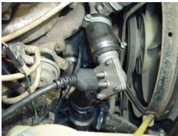
Рисунок 7 Монтаж подогревателя на ВАЗ-21213