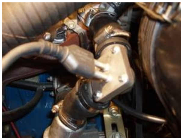
Рисунок 8 Монтаж подогревателя на ИЖ-2126-030