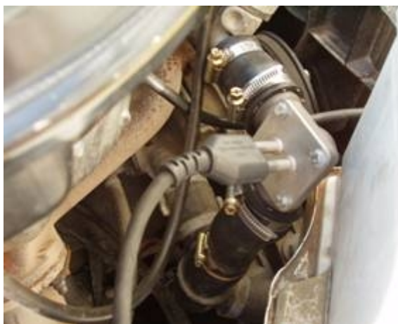
Рисунок 5 Монтаж подогревателя на VAZ-2101...2107

4.2 Монтаж подогревателя, на VAZ-2108...2115 (с укороченной подводящей трубой насоса)