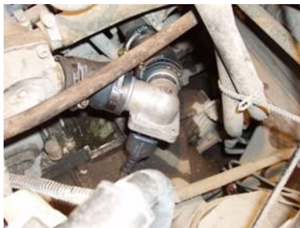
Рисунок 6 Монтаж подогревателя на VAZ-2110, инж. (8кл)

Перед монтажом на автомобилях VAZ-2108...2115 левый на рис. 3 (выходной) шланг укоротить на 20 мм со стороны внутреннего диаметра 32 мм. На шланги надеть хомуты и произвести монтаж по рис. 6 (пример монтажа подогревателя на VAZ-2110 с 8-ми клапанным инжекторным двигателем, на других автомобилях монтаж проводится аналогично). Затянуть хомуты.